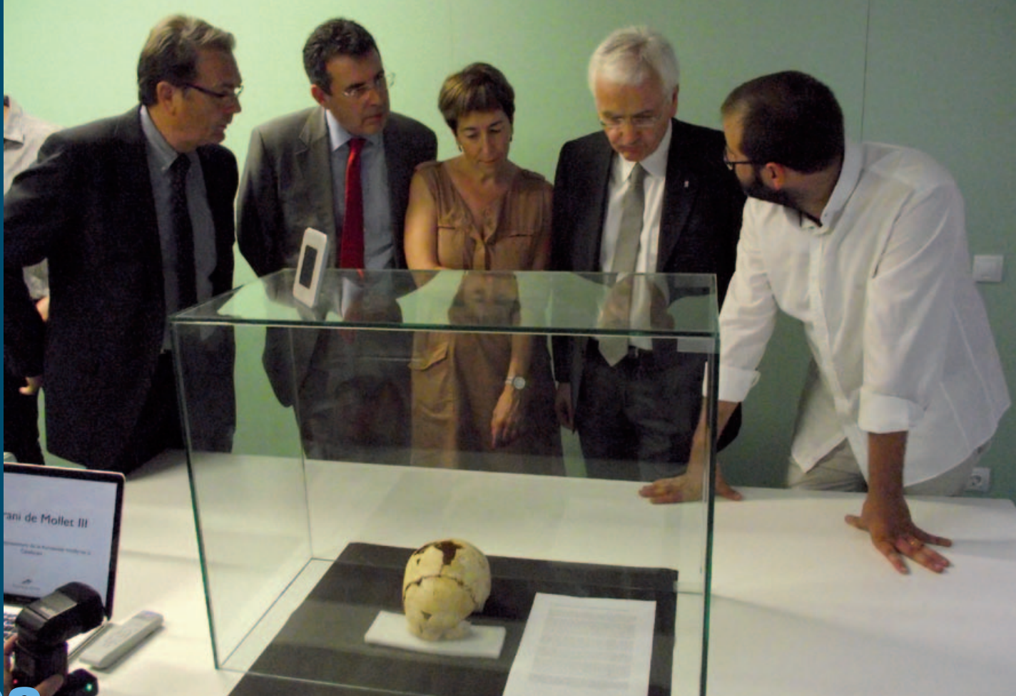
El crani va causar una gran expectació durant la roda de premsa