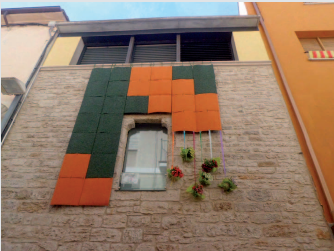
Primer premi de balcó artístic de la 36a Exposició de flors de Banyoles