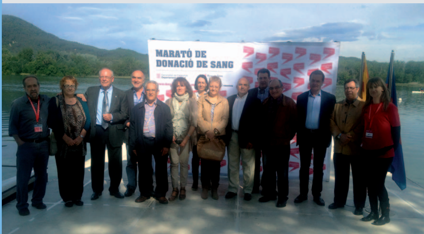
Entitats i administracions van unir esforços per la III Marató de Donació de Sang a Banyoles i el Pla de l'Estany