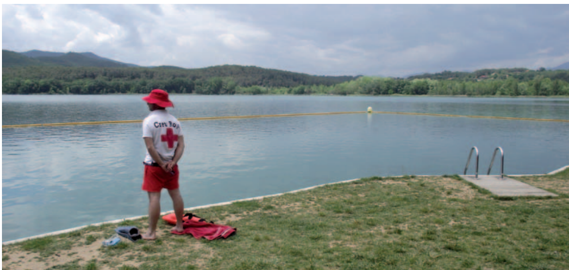
Com cada estiu tothom qui ho vulgui es pot banyar a la Caseta de Fusta

La temporada de bany per aquest 2013 a la zona de la Caseta de Fusta, situada a l'Estany de Banyoles, va començar el 8 de juny i acabarà l'11 de setembre, ambdós dies inclosos. Durant aquest període hi ha el servei de salvament i socorrisme de la Creu Roja - Assemblea del Pla de l'Estany. Els horaris de bany per aquest agost són de les 11 del matí a les 8 de la tarda i pel setembre de les 11 del matí a les 7 de la tarda. La Caseta de Fusta és un espai situat a la zona nord de l'Estany i per arribar-hi s'ha de seguir el camí que fa la volta a l'Estany. El cotxe es pot deixar a l'aparcament del parc de la Draga.