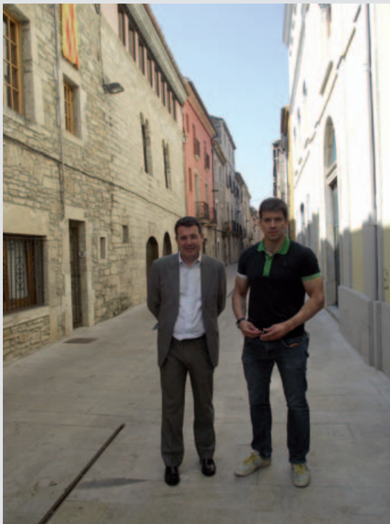
El carrer Nou totalment reformat