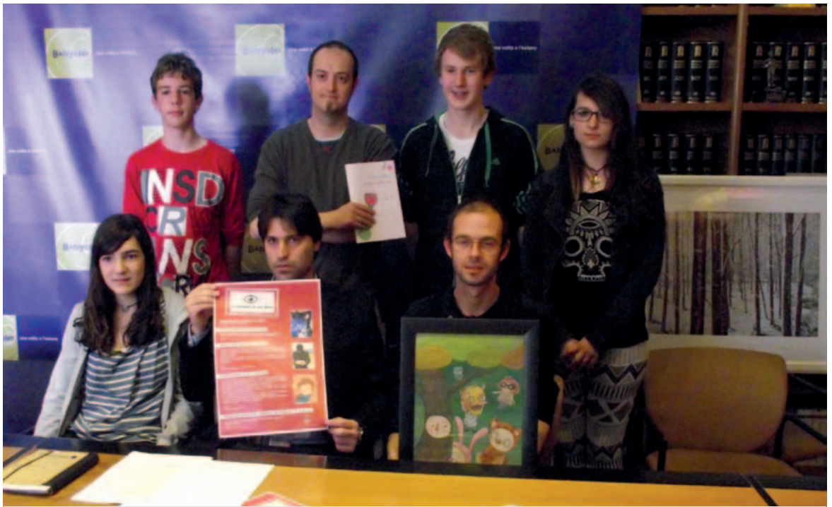
L'Espai jove Cal Drac té un espai per a les exposicions