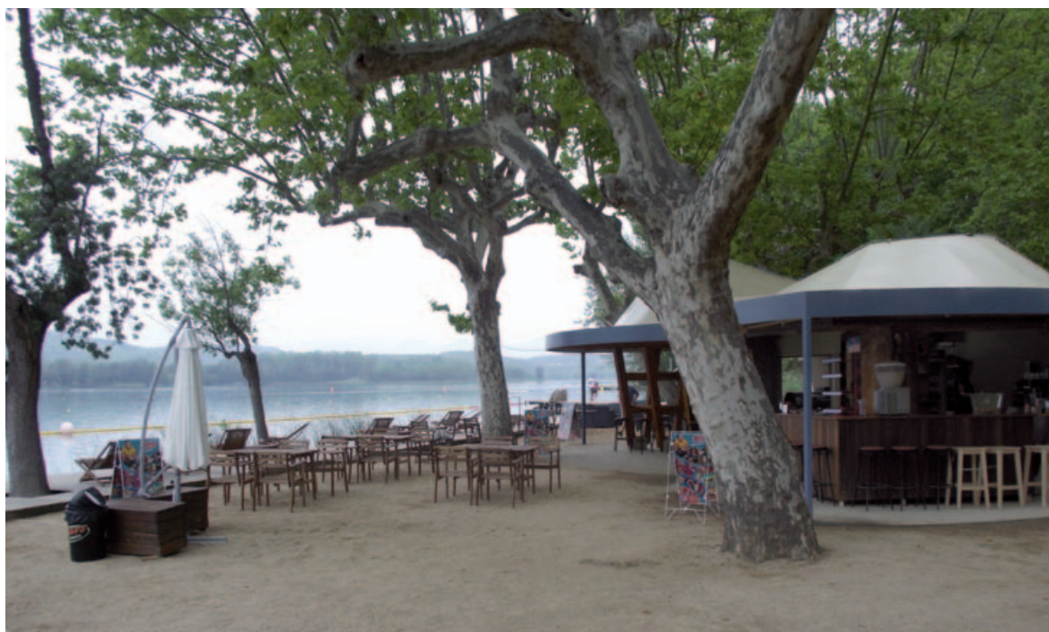
Els Bany Vells de bon matí, abans de rebre tots els visitants

Els Bany Vells ofereix un servei de bar de pinxos i tapes acompanyat d'amanides, entrepans i pizzes. A més de begudes, combinats, pastissos... I una novetat molt propícia per aquests dies calorosos d'estiu: amb una consumició tothom qui ho vulgui es podrà banyar a l'Estany.