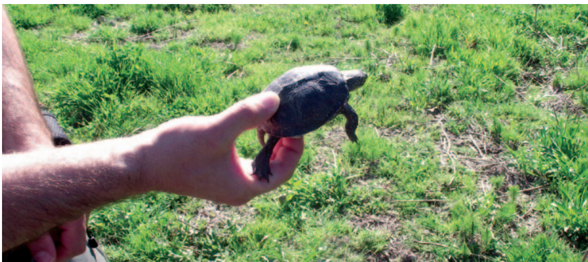
Una de les tortugues d'estany alliberades aquest 2013