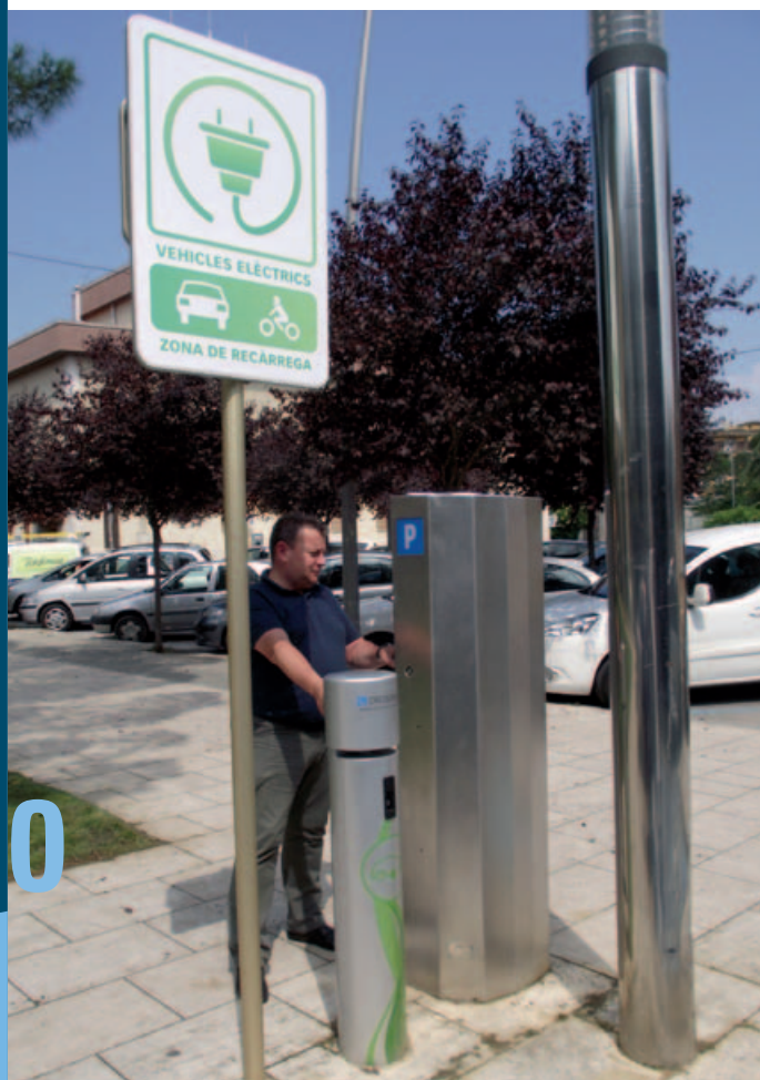
El punt de recàrrega de vehicles del costat de la façana posterior del Museu Darder de Banyoles