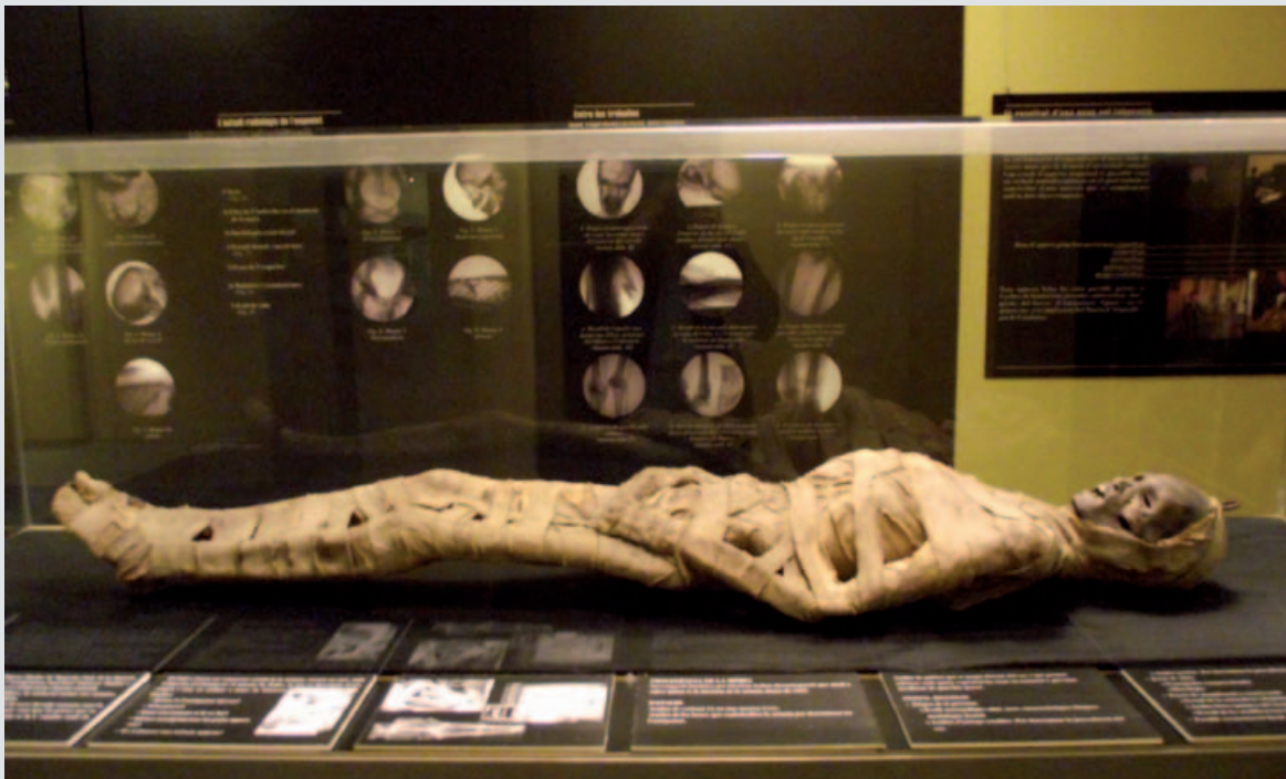
La mòmia suposadament egípcia del Museu Darder