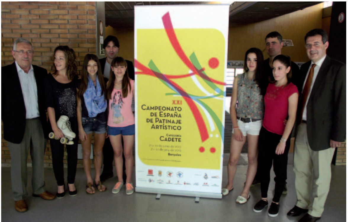
Banyoles novament seu d'una prova esportiva destacada, en aquest cas de patinatge artístic