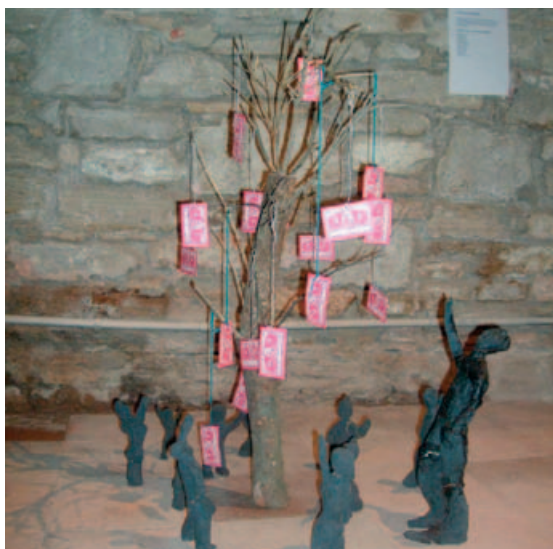
Una de les obres de l'exposició TINTXXI=CREACIÓ

El treball de l'activitat TINTXXI=CREACIÓ va culminar amb una exposició a la sala municipal d'exposicions El Tint. En aquesta exposició s'hi podien contemplar els 13 projectes artístics que van realitzar els 300 alumnes dels centres educatius que van participar en aquesta activitat, tots ells fruit del procés de reflexió entorn l'àmbit artístic de les instal·lacions que els nens i nenes van descobrir a partir de l'obra de l'artista Dani Fortià i l'acompanyament de Miquel Samaniego. L'activitat, que el Servei d'Educació, l'àrea de Cultura i el Col·lectiu TINTXXI van oferir als centres educatius de Banyoles per primera vegada, pretenia apropar els i les artistes de Banyoles i comarca a la