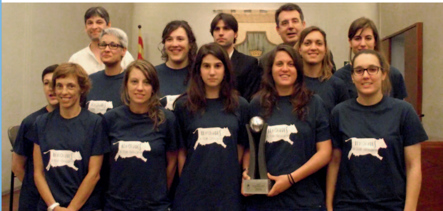
El sènior femení del Bencriada Banyoles amb el títol de campiones