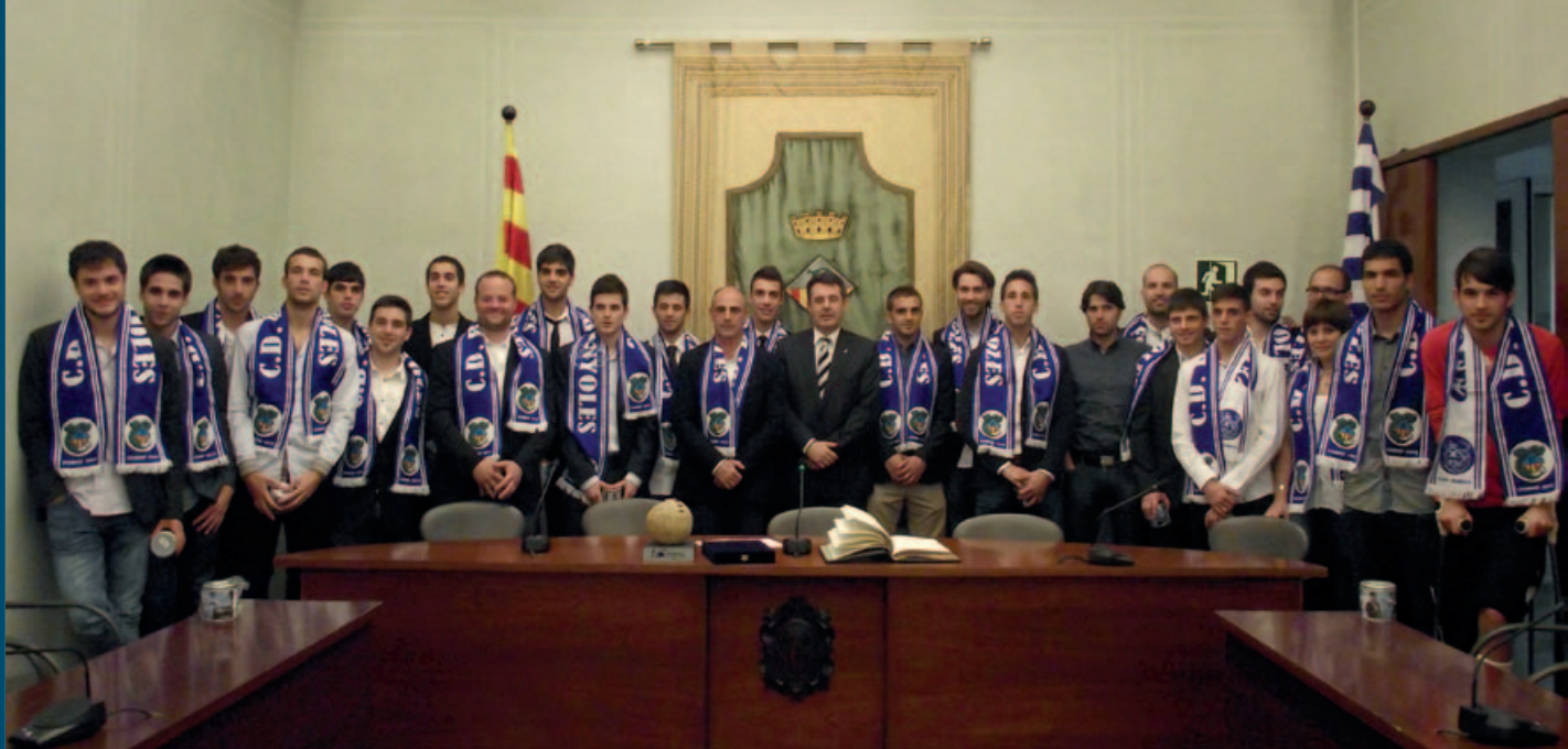
Els jugadors del CE Banyoles que han tornat l'equip a primera catalana