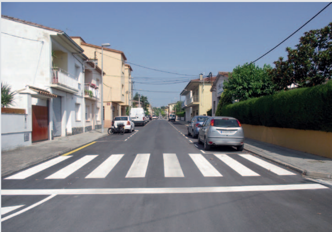
Tram reasfaltat del carrer Pere Alsius

Una bona part de la zona del Pla de l'Ametller tenia entre la vorera i la calçada un espai per a escocell d'aproximadament vuitanta centímetres. Era un espai pensat perquè la vorera no fos tota de panots, i planejada en el moment de fer la urbanització dels carrers. Tanmateix, aquest sistema no agradava als veïns, ni a l'Ajuntament de Banyoles i per aquest motiu s'hi han col·locat panots per acabar tota la vorera