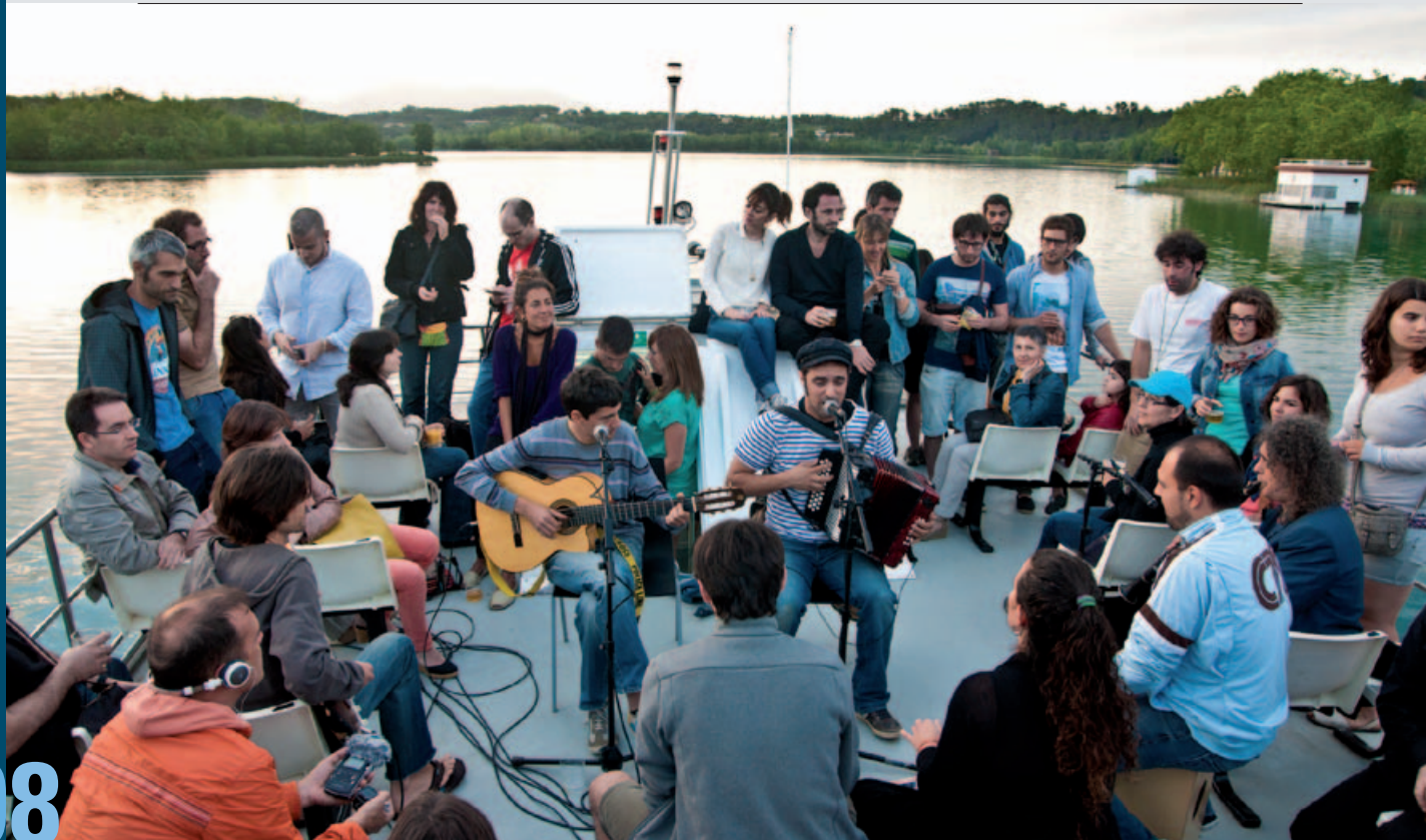
La barca Tirona, a més de turistes, va acollir un concert de l'(a)phònica, La Troba Kung-Fú