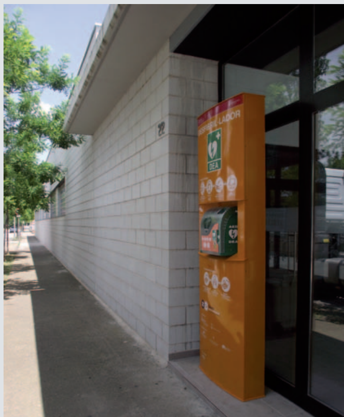
El desfibril·lador del Centre de tecnificació i formació esportiva de la Farga

D'aquestes 515 donacions, 465 es van fer efectives i la resta, 50 en total, van ser oferiments de persones que en aquell moment no van poder donar sang. Cal ressaltar les 81 persones que no havien donat mai sang i es van iniciar en la donació en aquesta Marató a Banyoles. Aquesta campanya del dia 1 de juny al Club Natació Banyoles va augmentar els baixos índex de sang existents al Banc de Sang i Teixits.