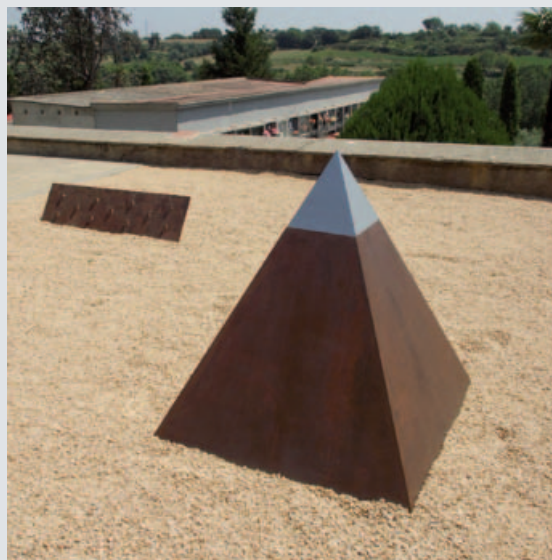
El Jardí del repòs és a la part alta del cementiri de Banyoles

El cementiri municipal de Banyoles, situat a la carretera de Figueres, disposa per primera vegada d'un Jardí del repòs. Es tracta d'un espai on les persones que ho desitgin podran dipositar les cendres dels difunts en una piràmide comunitària. El cementiri també disposa de columbaris per a usos individuals o familiars. El condicionament del Jardí del repòs ha estat una obra dins la concessió administrativa a AUFUCE SL, que és l'empresa encarregada del manteniment del cementiri. A la part del darrere de la piràmide de ferro hi ha un espai amb plataformes per posar flors i, si cal, plaques amb els noms dels difunts.